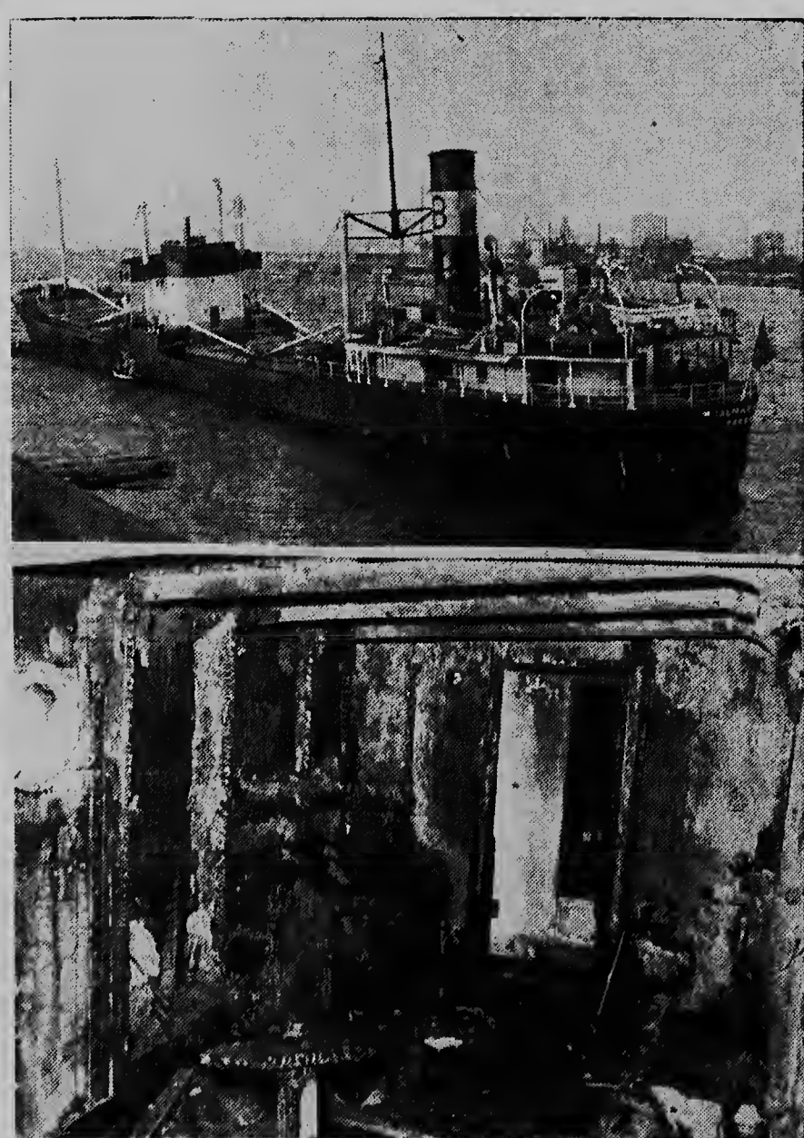
Dos remolcador, "Titan" y "Nestor" a halo un vapor di carga tur quima trece den haf na IJmuiden. Esaqui pama "Hjalmar Wessel" di 1712 ton. E vapor tabata queda victima di tempestad.